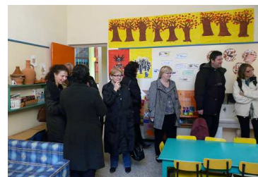
Visite des institutions

A travers des exposés, des rencontres avec des décideurs et des professionnels et des visites de terrain, nos collègues de France ont pu découvrir les spécificités du préscolaire marocain. Cette rencontre nous a permis de croiser nos regards, pour mieux comprendre nos différences et nos complémentarités.