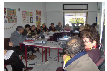
Exposé et débat