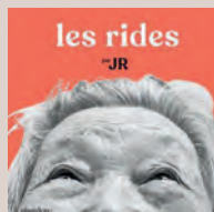
“Rides” JR, Phaidon, 2019,