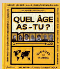
“Quel âge as-tu ?” JR, Phaidon 2021